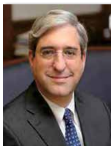
Dr. Peter Salovey (Ph.D) (President of Yale Univ.)